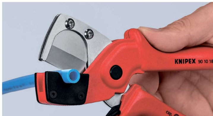
Благодаря эргономичным рукояткам, плавно работающему шарниру и пружинному механизму открытия, рез гибких труб или пневматических шлангов осуществляется с минимальным усилием