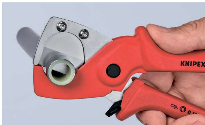
Острое высокопрочное лезвие